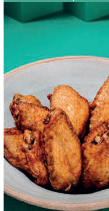
FRANGO À PASSARINHO