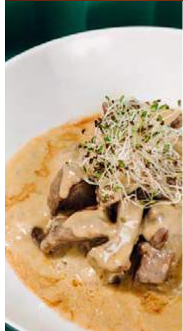
MIGNON AO MOLHO DE GORGONZOLA