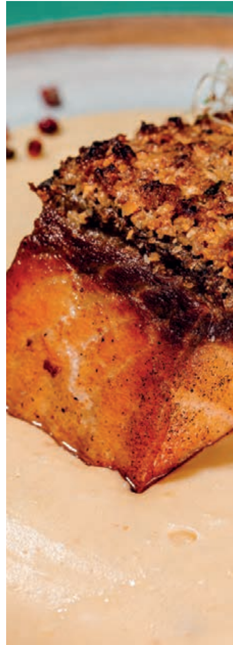
SALMONE IN CROSTA

Posta de salmão grelhado com crosta de castanha e aligot.