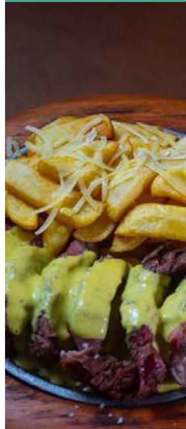
ENTRECOT COM MOSTARDA