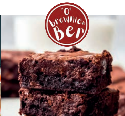
TRILOGIA DE BROWNIES