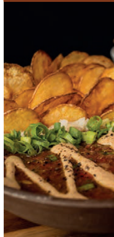
CARNE DE ONÇA