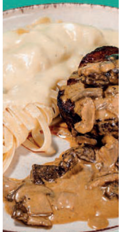
MIGNON & MIX DE FUNGHI