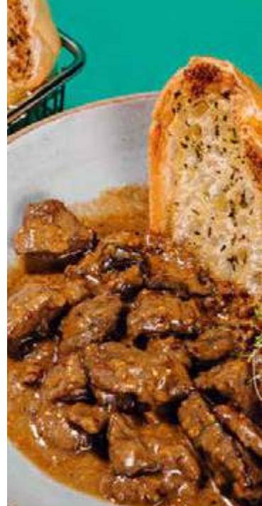
MIGNON A L'ANCIENNE

Mix de folhas com rúcula, cubos de frango, molho ceasar, croûtons e queijo parmesão.